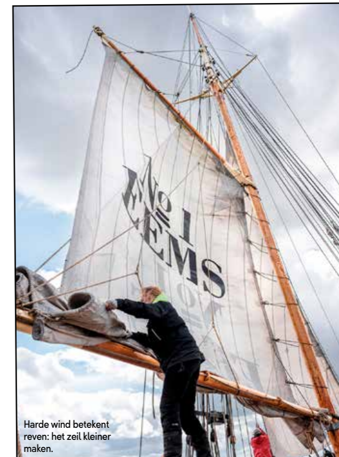
Harde wind betekent reven: het zeil kleiner maken.