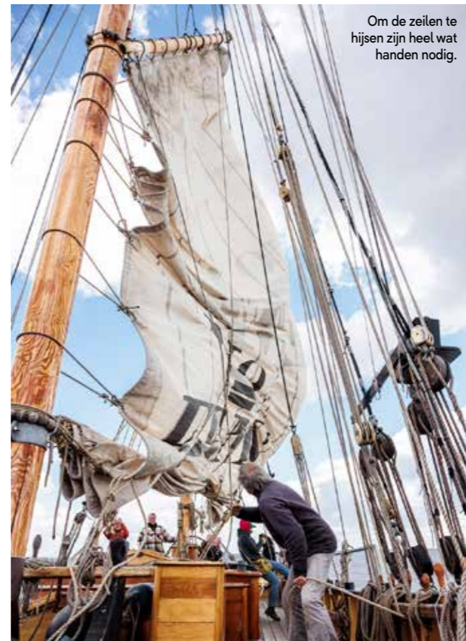
Om de zeilen te hijsen zijn heel wat handen nodig.