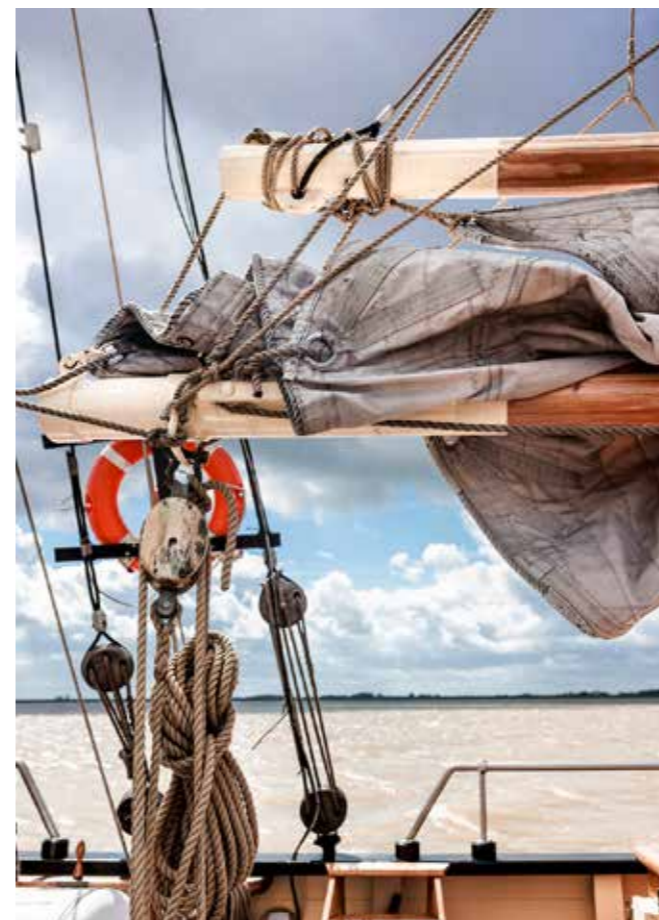
De wolkenluchten boven de Eems zijn overweldigend.

Loodskotter No. 1 Eems is een replica van de drie houten schepen die een eeuw geleden Delfzijl als thuishaven hadden. Bij toerbeurt voeren deze zeilschepen uit naar het zeegat tussen Borkum en Rottumeroog om daar, midden op zee, op klandizie te wachten. Zodra een koopvaardij-schip met bestemming Delfzijl aankwam, stapte een van de loodsen met een klein sloepje over naar het schip. Dat klinkt eenvoudiger dan het was, het beroep was bepaald niet ongevaarlijk. Ook in gierende stormen en bij golven van zes meter of hoger moesten de mannen aan boord van het koopvaardij-schip zien te komen. Want alleen een loods, die de geulen en ondieptes op de Waddenzee en de Eems kende, kon een schip veilig in de haven krijgen. In de loop van de tijd kwamen meerdere loodsen om het leven tijdens het overstappen op zee. Ook vergingen loodsschepen met man en muis. In 1921 verongelukte de Delfzijlster Loodsschoener No. 2. Geen van de elf opvarenden werd ooit teruggevonden. Ook bij Terschelling verging een loodsschip met volledige bemanning. Van de Delfzijlster schepen is geen houtsplinter overgebleven. Gelukkig vielen de bouwtekeningen nog te achterhalen toen het idee rees om een replica te bouwen. In zeven jaar tijd verrees op de havenkade een originele, maar compleet nieuwe loodskotter met een romplengte van 18,5 meter (met motor en alle veiligheidsvereisten van deze tijd).